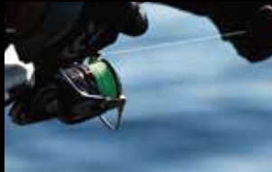
1 仕掛け投入後にノブを半回転させてドラッグを緩める

ドラッグがゆるゆるの状態でもラインに加わる力は想像以上に大きく、しっかりとハリ掛かりする。