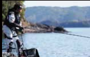
2 仕掛けを流し、アタリに備える