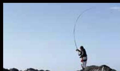
飛距離に優れたPEラインは、黒鯛の遠投釣法で力を発揮！