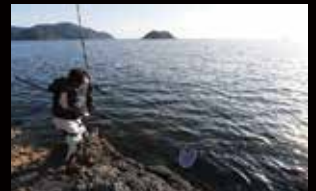
4 必要に応じてレバー操作をしながらやり取りする