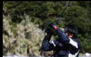
3 合わせを入れたらノブを半回転させてドラッグを締める