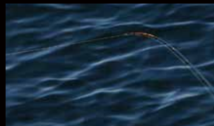
磯用PEラインの登場によりウキフカセ釣りも新たなステージに突入

直線強力が高いPEラインは、ナイロンより格段に細い号数が使えるため、より遠投が効くようになる。沖のポイントをダイレクトに狙う遠投釣法では、このメリットは非常に大きい。そして、伸びがほとんどないPEラインは、アタリがよりダイレクトに伝わる。沈め釣りにおいてこの効果は絶大で、ウキを浮かせる釣りでも反応がより鋭敏に表れることから、今まで見過ごしていたアタリや、食い込みに至らない黒鯛の気配、反応が、より一層感じとれるようになった。