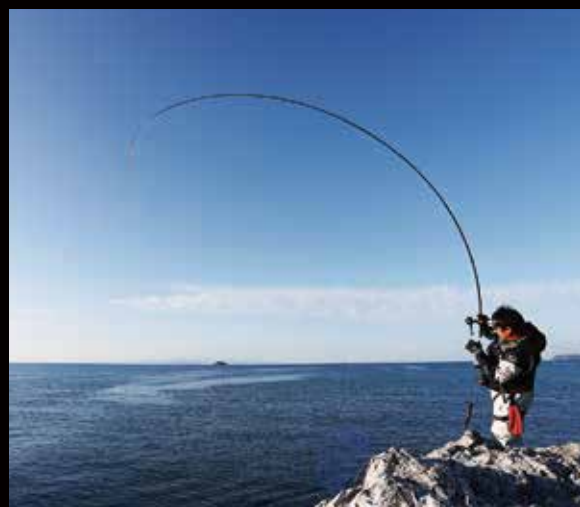
PEラインのアフセ切れを防ぐのがクイックドラッグ(QD)の役割

これまであまり語られてこなかったデメリットも聞かれるようになった。それは「アフセ切れ」の問題である。直線強力が高いPEラインも、テンションが緩んだ状態で急激な負荷がかかると、ほとんど伸びがないという特性がマイナスに作用し、一瞬でプツリと切れてしまうことがある。合わせ切れを防ぐには、ドラッグを緩く設定しておくのが効果的だが、やり取りに移行する際にドラッグノブを何回も回して締め込むのは、手間と時間を要する。その弱点を補うために、銀狼シリーズの新LBリールに搭載されたのが、わずかな動作でドラッグ力が大きく変わる、「クイックドラッグ(QD)」という機構である。